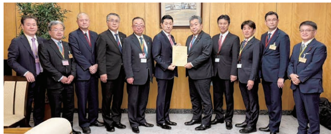
【令和8年3月23日】自民党滋賀県議会議員団経産省要望 小鎌隆史参議院議員(左) 小寺裕雄衆議院議員(右)