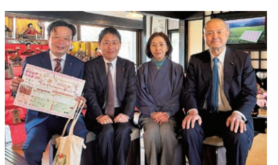
【令和8年3月1日】東海道士山宿ひな祭り