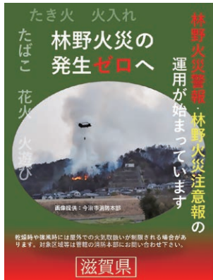
「林野火災注意報・警報」発令チラシ▲

条例施行日から2月19日までに、林野火災注意報が7市町に延べ35回、林野火災警報が6市に延べ21回発令されたところでございます。