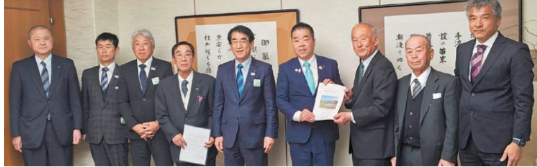
【令和8年3月18日】甲賀市の産業廃棄物最終処理場建設に関する農業関係5団体からの知事要望 野洲川土地改良区/甲賀農業協同組合/土山町土地改良区/土山町茶業協会/農政連甲賀支部