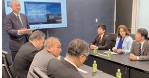
【令和8年1月28日～30日】厚生・産業・企業常任委員会県外行政調査