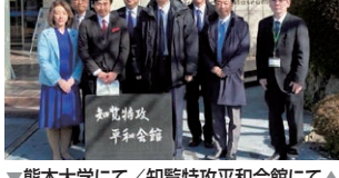
▼熊本大学にて/知覧特攻平和会館にて▲