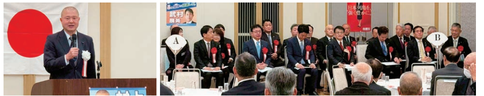
【令和8年2月14日】村上げんよう新春のつどい 来賓紹介 多くの皆様にご多用の中ご臨席賜りました