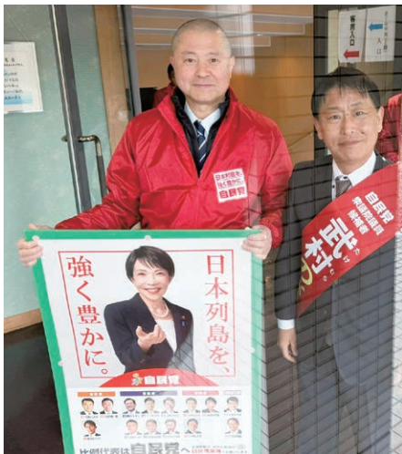
【令和8年1月31日】第51回衆議院議員選挙