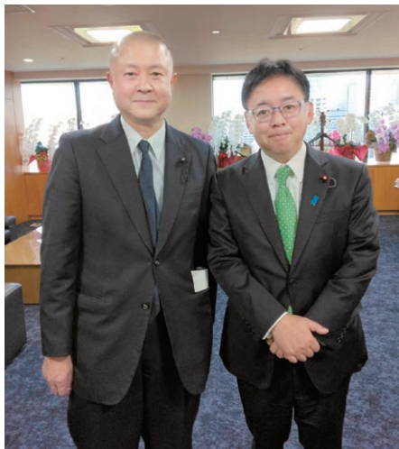
【令和8年3月23日】自民党滋賀県議会議員団厚生省要望 上野賢一郎厚生労働大臣(右)