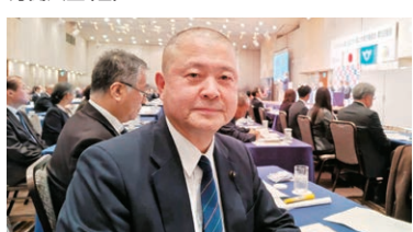
【令和8年3月26日】わたSHIGA輝く 国スポ・障スポ 実行委員会