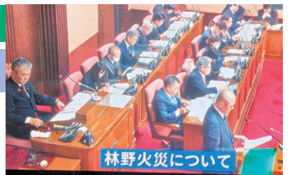
林野火災について

火事はそのにある全ての財産を灰に化し、生命を奪われることもあり、とても恐ろしいことです。山に住み、山を守るものとして、山を愛する心で、林野火災について、一般質問を行います。