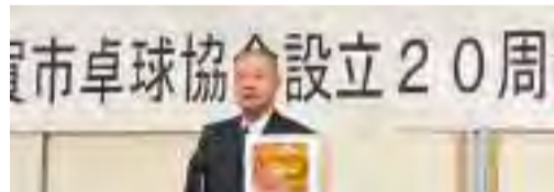
【7月13日】甲賀市卓球協会設立20周年記念祝賀会