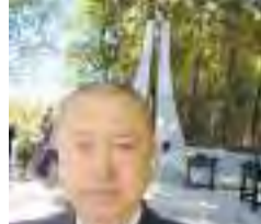
【5月14日】信楽高原鉄道列車 事故犠牲者追悼法要