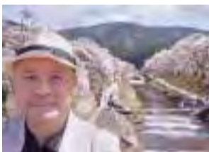
【4月7日】鮎河さくらまつり