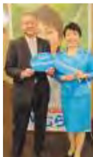
【4月20日】有村治子参議院議員 国政報告会