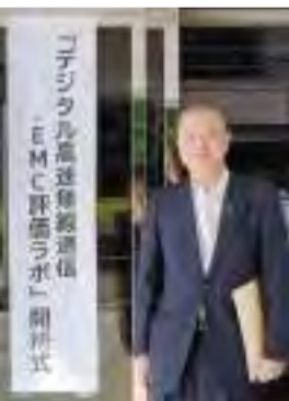
【5月8日】県立工業技術総合センター 厚生・産業・企業常任委員会副委員長として参加