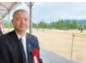
【4月27日】陸上自衛隊大津駐屯地 「中部方面混成団」記念行事