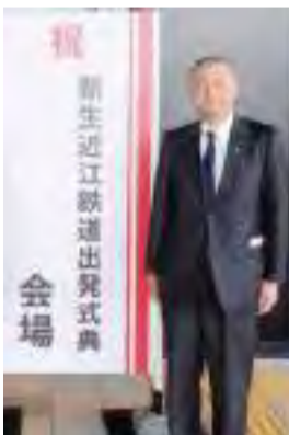
【4月5日】新生近江鉄道出発式 米原市役所で開催