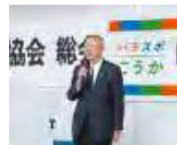
【5月18日】甲賀市パラスポーツ協会総会