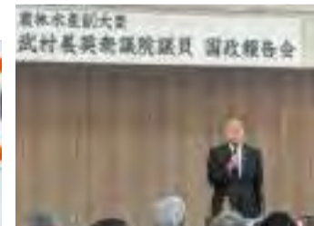
【5月25日】武村展英農林水産副大臣国政報告会