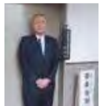
【4月26日】4月招集会議 令和6年度の役員が決定 新たな体制で県政を進め てまいります