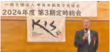
【5月25日】一般社団法人甲賀市国際交流協会 2024年度第3期定時総会