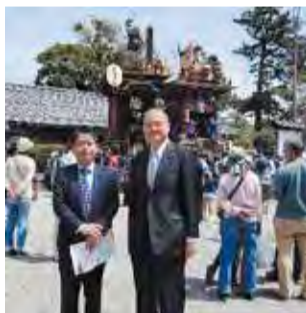
【4月20日】水口神社例大祭 水口曳山まつり 武村展英農林水産副大臣と