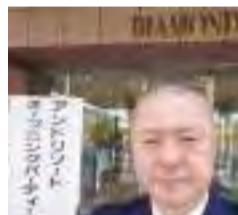
【4月12日】ダイヤモンド滋賀 アンドリゾート オープニングパーティ