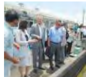
【7月17日】琵琶湖・森林政策特別委員会 県内行政調査