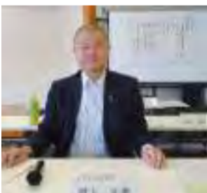
【5月17日】甲賀湖南道路整備促進期成同盟会総会 主要地方道草津伊賀線促進期成同盟会総会