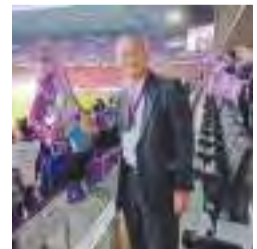
【6月1日】亀岡スタジアム見学