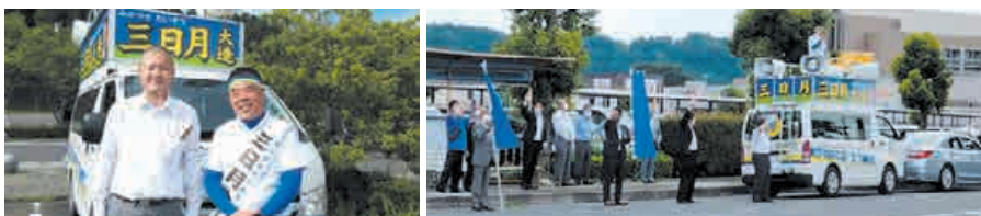
三日月大造滋賀県知事(右)と