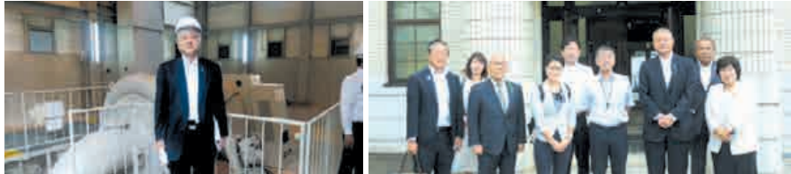
永源寺水力発電所 視察