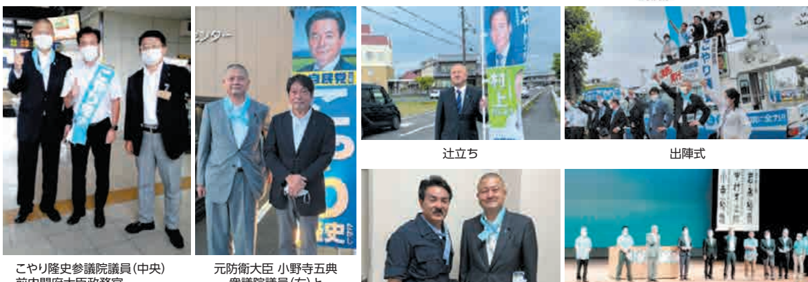
こやり隆史参議院議員(中央) 前内閣府大臣政務官 小寺ひろお衆議院議員(右)と