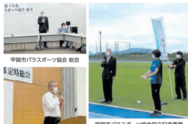
甲賀市パラスポーツ協会 総会