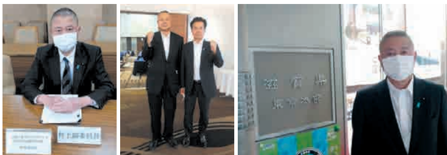
各常任・特別委員会 議会運営委員会 正副委員長会議