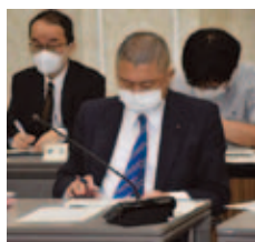
厚生・産業常任委員会