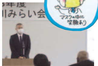
貴生川みらい会議総会・挨拶