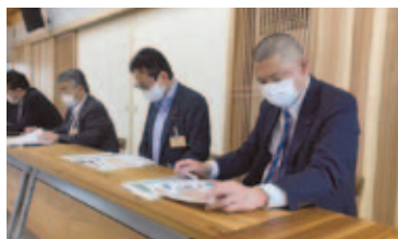
滋賀県林業会館視察