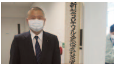
甲賀市役所・新型コロナウイルス感染症対策室視察