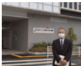
淡海ふれあい病院視察