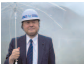
大戸川ダム勉強会