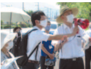
地方創生特別委員会県内行政調査