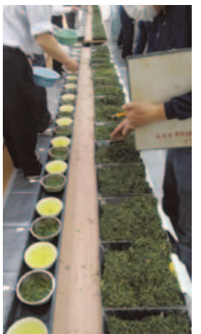
近江のお茶入札販売会視察