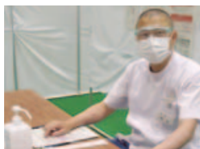
ワクチン集団接種出動(水口体育館)